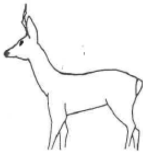
JEUNE silhouette fine et élancée